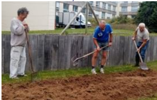
Bénévoles des jardins partagés